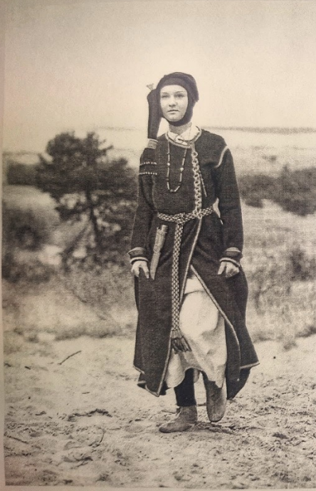
Modelis Nr. 1